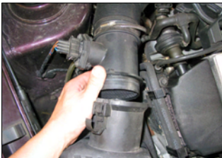
Fig. # 1

FILTER MAINTENANCE: K&N suggests checking the filter periodically for excessive dirt build-up. When the element becomes covered in dirt (or once a year), service it according to the instructions on the Recharger service kit available from your K&N dealer, part number 99-5000 or 99-5050.