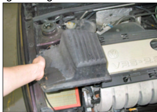
Fig. # 2