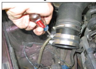
Fig. # 9