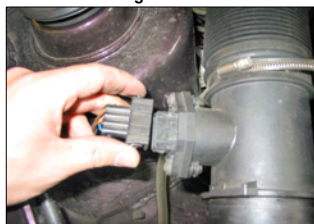
Fig. # 4