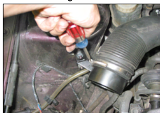
Fig. # 8