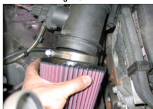
Fig. # 12