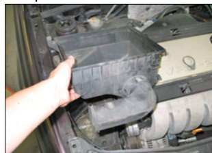
Fig. # 3