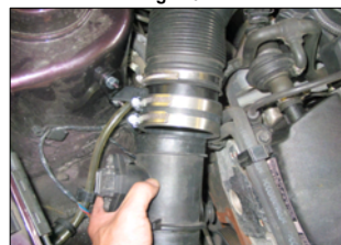
Fig. # 10