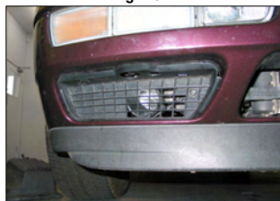
Fig. # 13