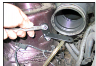
Fig. # 7