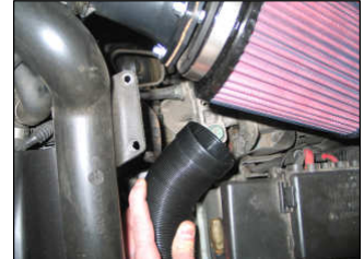
Fig. # 16