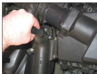
Fig. # 2