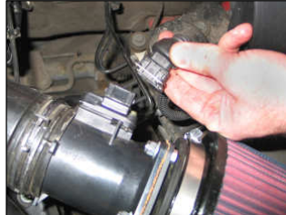
Fig. # 15