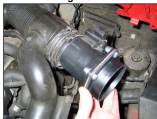
Fig. # 10