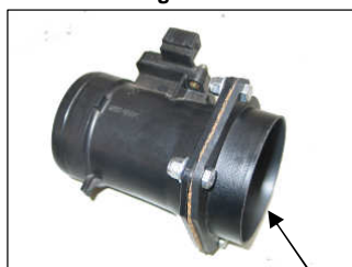
Fig. # 9