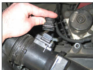
Fig. # 1

For cleaning instructions please visit our website: www.knfilters.com/cleaning