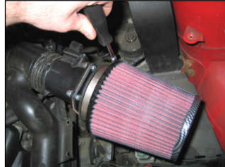
Fig. # 14