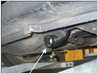
Fig. # 17