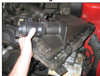
Fig. # 5