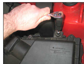
Fig. # 4