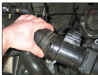
Fig. # 3