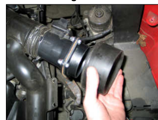
Fig. # 12

For technical support contact our European technical team: "eindhoven.tech@knfilters.com" We will try to answer your mail within 48 hours. For UK technical enquiries contact R&D department at 01925-636950, Mon-Thu from 8:30 am to 5 pm.