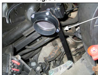
Fig. # 11