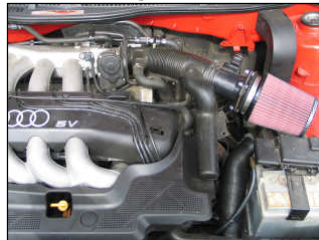
Fig. # 18