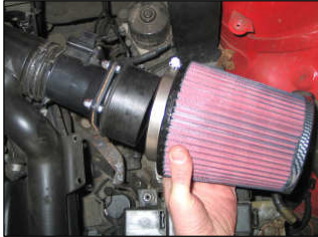
Fig. # 13