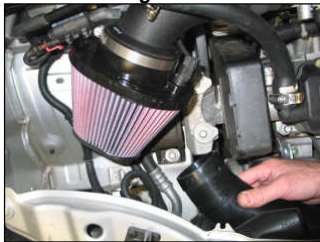
Fig. # 25