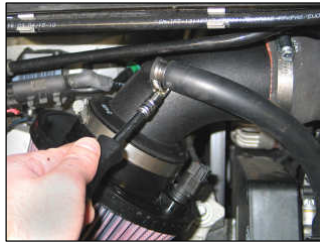
Fig. # 22