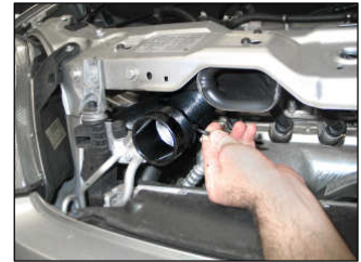
Fig. # 24