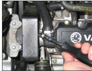
Fig. # 23