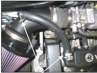
Fig. # 21