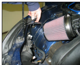
Fig. # 11