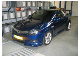
Fig. # 13