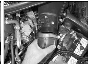
Fig. # 4