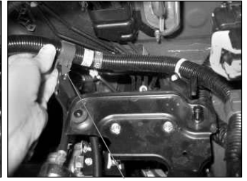
Fig. # 8