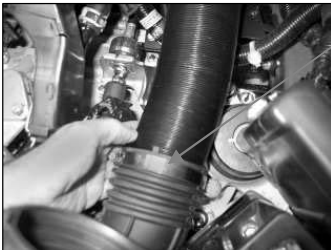
Fig. # 17