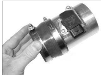
Fig. # 14