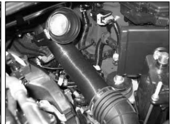
Fig. # 20