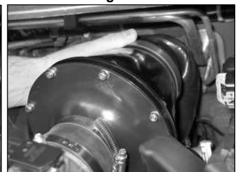
Fig. # 28