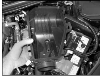
Fig. # 7