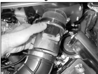
Fig. # 25