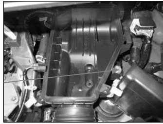
Fig. # 6