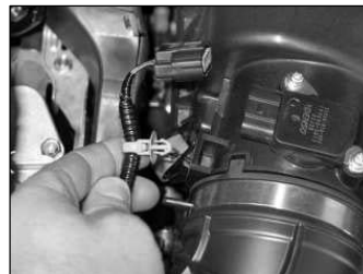
Fig. # 2