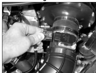
Fig. # 27