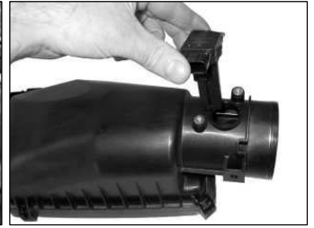
Fig. # 12