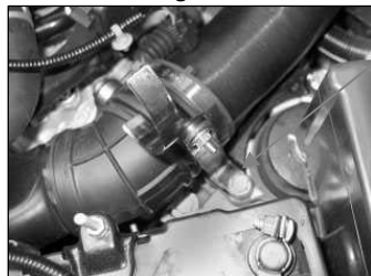
Fig. # 22