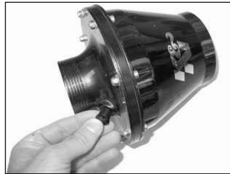
Fig. # 15