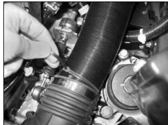
Fig. # 18