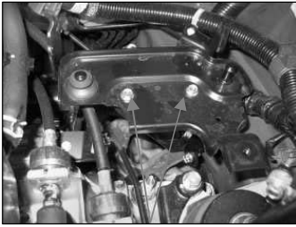
Fig. # 9