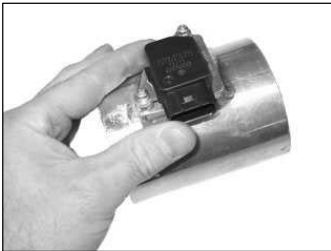
Fig. # 13