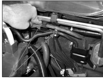
Fig. # 10