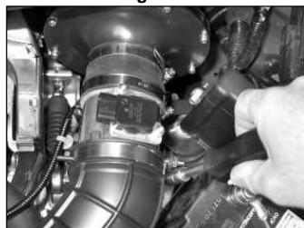
Fig. # 26