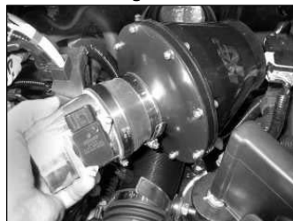
Fig. # 23