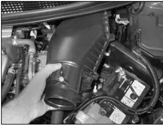
Fig. # 5