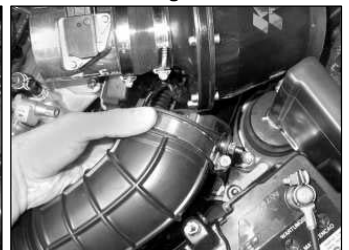
Fig. # 24