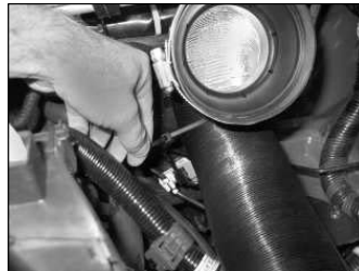
Fig. # 19