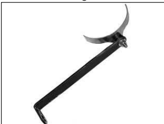
Fig. # 21